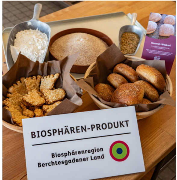
Neue Biosphären-Produkte: Bergsteigerglück und Hoamat Weckerl, von angehenden Bäckerinnen und Bäckern kreiert

Weitere Informationen und eine Liste aller Bäckereien gibt es unter: www.biosphaerenregion-bgl.de/biosphaerenbackwaren