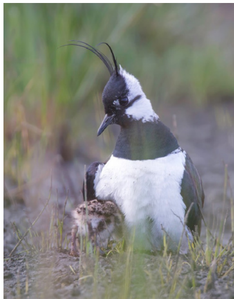
Das Kiebitzküken braucht in den ersten Lebenstagen noch viel Wärme vom Elterntier

https://starnberg.lbv.de/ornithologie/vogelportraits/kiebitz/