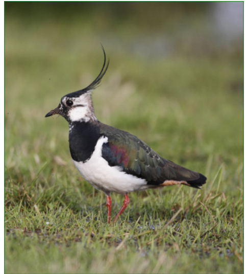
Neues Artenschutzprojekt von Biosphären-Verwaltungsstelle und Landschaftspflegeverband hat den Kiebitz im Fokus

Wie viele andere Bodenbrüter ist der Kiebitz in Bayern mittlerweile stark gefährdet. Früher war der Kiebitz ein fester Bestandteil unserer Kulturlandschaft – doch in den letzten 30 Jahren sind die Bestände bayern- und deutschlandweit um fast 90 % zurückgegangen, sodass die einstige „Allerweltsart“ damit in Bayern zu einer der am bedrohtesten Brutvogelarten geworden ist. Um die verbliebenen Kiebitz-Vorkommen zu schützen und zu fördern, haben der Landschaftspflegeverband Biosphärenregion Berchtesgadener Land e.V. und die Verwaltungsstelle der Biosphärenregion ein Artenschutzprojekt für den Kiebitz ins Leben gerufen.