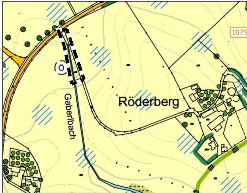
Rechtskräftiger Flächennutzungsplan vom 30.11.2010